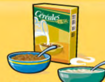
Céréales Froides : 30 g Chaudes : 175 mL (½ tasse)