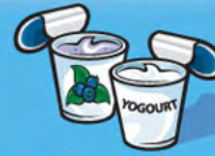
Yogourt 175 g (¾ tasse)