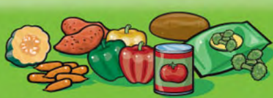
Légumes frais, surgelés ou en conserve 125 mL (½ tasse)