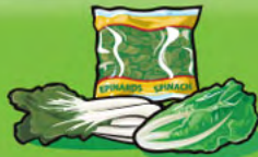
Légumes feuillus Cuits : 125 mL (½ tasse) Crus : 250 mL (1 tasse)