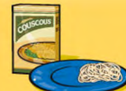
Pâtes alimentaires ou couscous, cuits 125 mL (½ tasse)