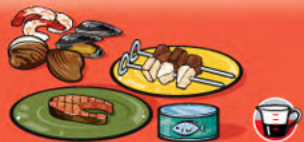
Poissons, fruits de mer, volailles et viandes maigres, cuits 75 g (2 ½ oz)/125 mL (½ tasse)