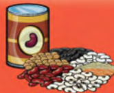
Légumineuses cuites 175 mL (¾ tasse)