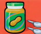
Beurre d'arachide ou de noix 30 mL (2 c. à table)