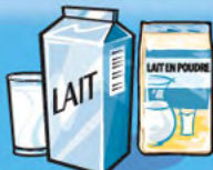
Lait ou lait en poudre (reconstitué) 250 mL (1 tasse)