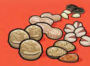
Noix et graines écalées 60 mL (¼ tasse)