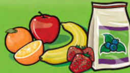
Fruits frais, surgelés ou en conserve 1 fruit ou 125 mL (½ tasse)