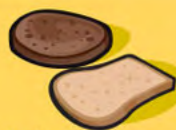
Pain 1 tranche (35 g)