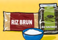
Riz, boulgour ou quinoa, cuit 125 mL (½ tasse)